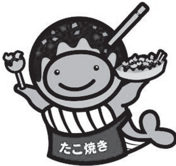
たこ焼きクーちゃん

「サマージャンボ宝くじ」及び「ハロウィンジャンボ宝くじ」の収益金は、販売実績等に応じて、各都道府県市町村振興協会に配分されます。